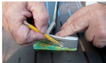
Die Form übertragen.

Wir haben dann als ersten Schritt die Schlagfläche des Putters auf das Schlägergummi gelegt und den Umriss mit einem Bleistift angezeichnet. An der Bleistiftlinie wurde dann mit einem Teppichmesser die Form nach geschnitten. Da das Schlägergummi, ich hatte aus früheren Einkäufen noch ein schönes bunte herumliegen, 10 mm stark war, brauchte es schon einige Schnitte um durch das Material durchzukommen. An-