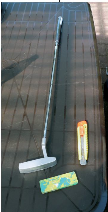
Der gekaufte Putter, ein Schlägergummi mit Teppichmesser